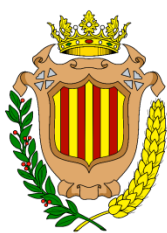
Escudo de Patraix

Queremos que Patraix tenga su propia mascota para que nos represente este año 2020 y en adelante. Pues este 2020 se cumplen 150 años de que Patraix dejó de ser pueblo y se anexionó a València.